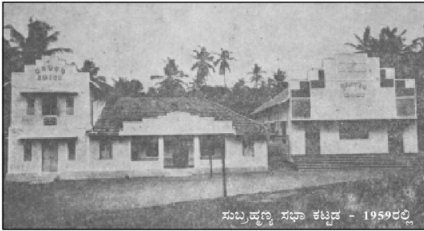
ಸುಬ್ರಹ್ಮಣ್ಯ ಸಭಾ ಕಟ್ಟಡ - 1959ರಲ್ಲಿ

30-12-1925ರಂದು ಶ್ರೀ ನಟ್ಟೋಜಿ ವಿಷ್ಣುರಾಯರ ಭವನದಲ್ಲಿ ಸುಮಾರು 73 ಮಂದಿ ಸಮಾಜ ಬಾಂಧವರ