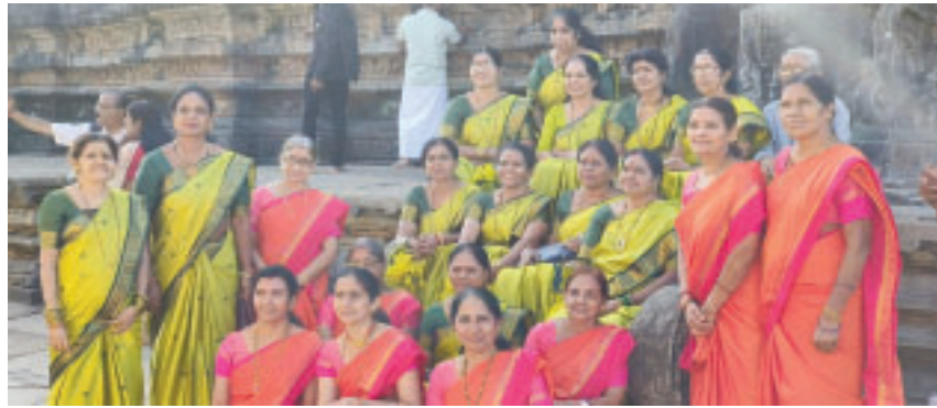
ತಾ. 25-26 ಡಿಸೆಂಬರ್ 2023 ರಂದು ಶೃಂಗೇರಿಯಲ್ಲಿ ಆಹ್ವಾನಿತ ಶ್ರೀ ಶಾರದಾ ಭಜನಾ ಮಂಡಳಿ, ಉಡುಪಿ, ಶಂಕರ ಪ್ರತಿಷ್ಠಾನ, ಕಾರ್ಕಳ ಹಾಗೂ ಶ್ರೀ ಜ್ಞಾನಶಕ್ತಿ ಭಜನಾ ಬಳಗ, ಬಾರಕೂರು ಒಟ್ಟಾಗಿ ಧನುರ್ಮಾಸದ ಭಜನಾ ಕಾರ್ಯಕ್ರಮವನ್ನು ನೆರವೇರಿಸಿಕೊಟ್ಟರು.

ಹಿರಿಯರ ಮಾತನ್ನು ಕೇಳಿ ಅಥವಾ ಒಳ್ಳೆಯ ಪುಸ್ತಕಗಳ ಮಾರ್ಗದರ್ಶನ ಪಡೆದುಕೊಂಡು, ವಿಷಾದದಿಂದ ಹೊರಬಂದು ತಮ್ಮ ಗುರಿಯ ಕಡೆಗೆ ಹೆಚ್ಚಿನ ಉತ್ಸಾಹದಿಂದ ಸಾಗಬೇಕು. ಆಗಲೇ ಸಿದ್ಧಿ ಎನ್ನುವುದು ವಿಷಾದಯೋಗದ ಸಂದೇಶ. 2 ಸಾಂಖ್ಯಯೋಗ-ಅಪಾಯಕರ ಖಿನ್ನತೆ ಅರ್ಜುನನಿಗೆ ಎಲ್ಲಿಂದ ಬಂತು? (3ನೇ ಪುಟಕ್ಕೆ....)