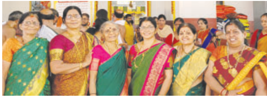
ಕೋಟಿ ಹಿರೇ ಮಹಾಲಿಂಗೇಶ್ವರ ದೇವಸ್ಥಾನದಲ್ಲಿ ಕೋಟಿ ಗಾಯತ್ರಿಯಾಗ ಮತ್ತು ಲಕ್ಷ ಲಲಿತಾ ಸಹಸ್ರನಾಮಯಾಗದ ಸಂದರ್ಭದಲ್ಲಿ ಶ್ರೀ ಶಾರದಾ ಭಜನಾ ಮಂಡಳಿಯ ಸದಸ್ಯರು.